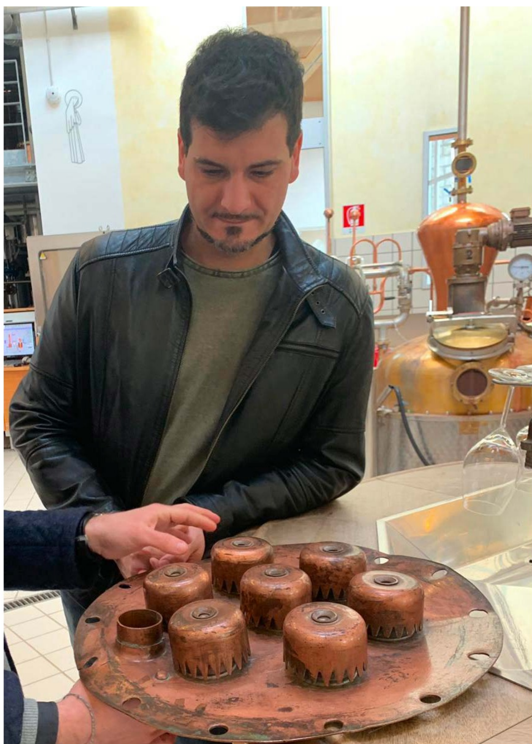
Leonardo illustra un piatto in rame di una colonna di distillazione

Negli ultimi decenni la grappa ha avuto una costante crescita in termini di qualità e versatilità, pur mantenendo un forte legame territoriale e culturale. Attraverso articoli dedicati sulla piattaforma online www.grappaevolution.it verranno illustrate le innovazioni tecnologiche e le nuove tendenze nel mondo della grappa, oltre che informazioni su disciplinari, novità di mercato ed eventi. Il sito ha inoltre una sezione dedicata alla miscelazione, in cui verranno raccolti e pubblicati alcuni dei migliori drink base grappa realizzati da bartender di ogni paese.